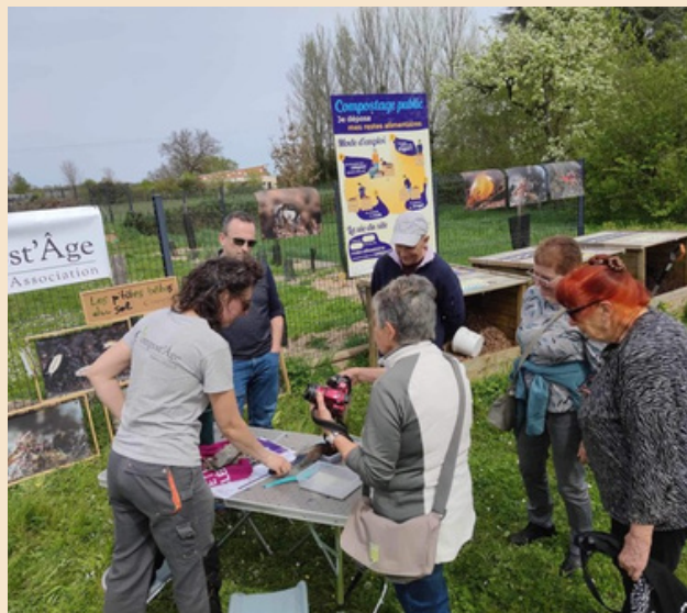
Atelier compostage à Savigny-L'Evescault