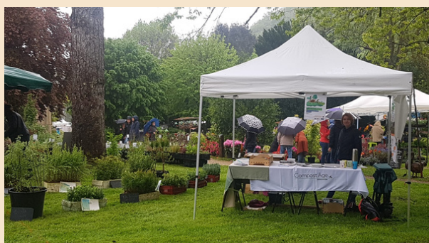
Fête des fleurs de St Benoit