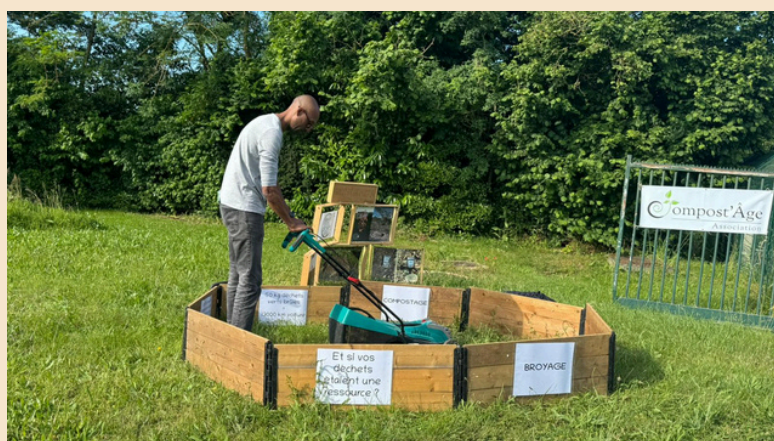
Animation en déchetterie