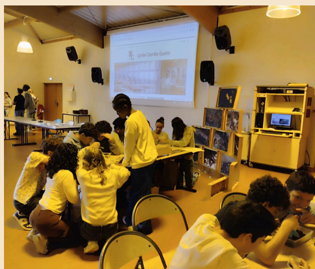
Lycée Camille Guréin