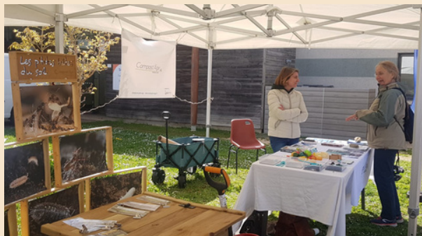
Fête de la biodiversité 2024