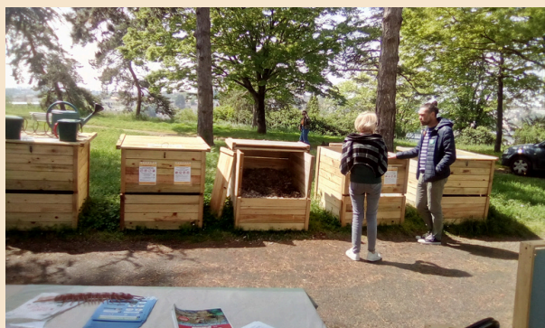
Atelier sur un site de compostage public